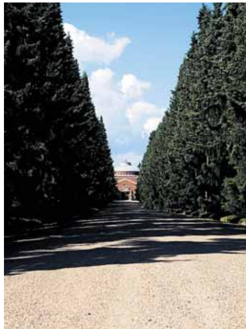
Matkan pää. Malmilan hautausmaalla on noin 50 000 viimeistä leposijaa.

Kirkko saa osan valtion yhteisöveron tuotosta, mutta kaikissa seurakunnissa se ei kata hautaustoimen kuluja. Monet seurakunnat joutuvat käyttämään myös kirkollisverovarjoaan hautausmaiden ylläpitoon. Sellaiset seurakunnat voisivat muuttaa maksuttomia hautaustoimen palveluja maksullisiksi ja vähentää näin kirkollisverojen käyttöä hautausmaihin.