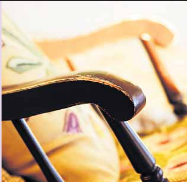
Vanha tuoli. Tässä on moni ehtinyt isuta jo ennen minua.