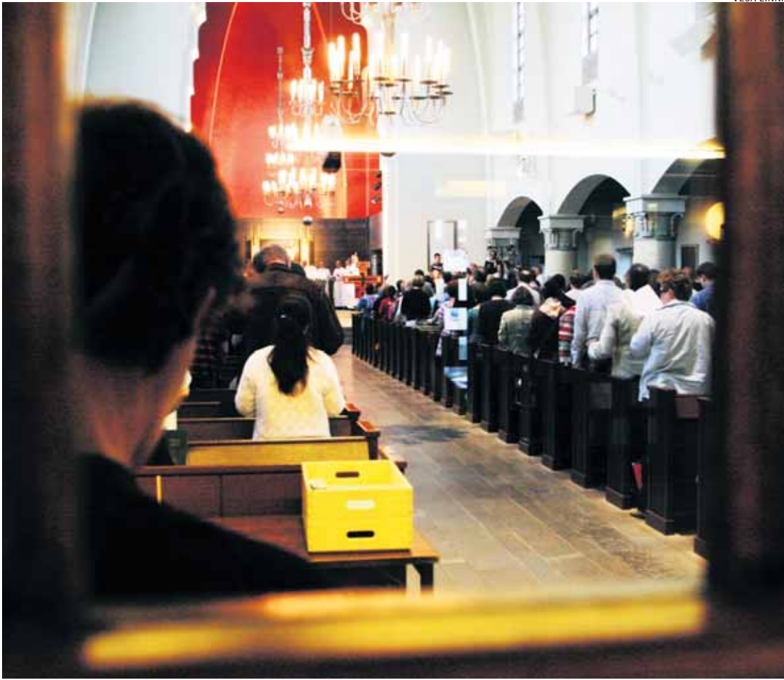
Yhteyttä etsimässä. Tuomasmessuun riittää tulijoita läpi kesän.